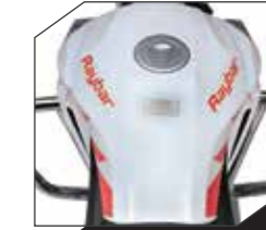
Gran Tanque de Combustible (15lts)