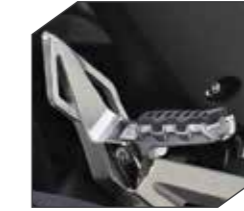
Pedalines de Aluminio