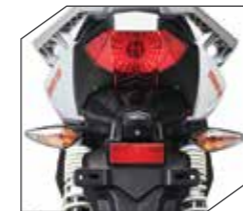
Elegante Luz Trasera e Indicador