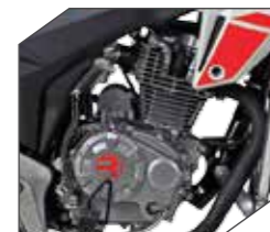
Motor 150 CC

Este gentil vehículo despliega un corazón de hierro. Un poderoso motor 150cc te llevará a donde sea en minutos. Abraza el poder y anota cada victoria