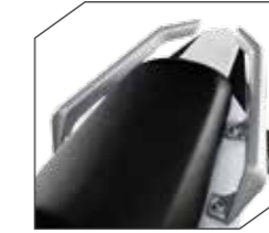
Agarramanos Traseros de Aluminio