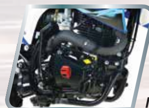
Motor – Máximo poder