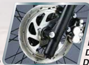
Freno a Disco Delantera de Doble Cilindro