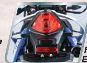
Faro Trasero Elegante