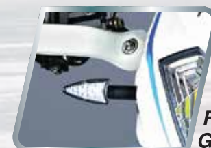
Faros de Giro LED