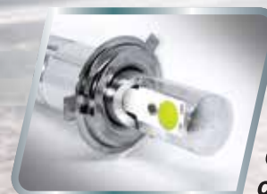
Óptica Delantera con Lámpara LED